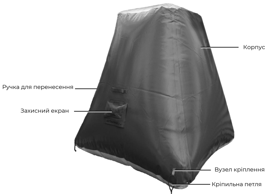
Основні елементи надувного укриття

Компанія AIRBUNKER виробляє надувні укриття різних форм і розмірів, але конструкція у них практично однакова.