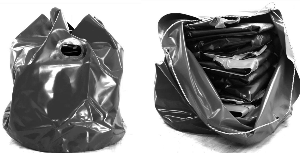
Пакувальні сумки для надувних фігур

У складеному вигляді комплект надувних укриттів для облаштування майданчику вміщується в багажник легкового автомобіля.