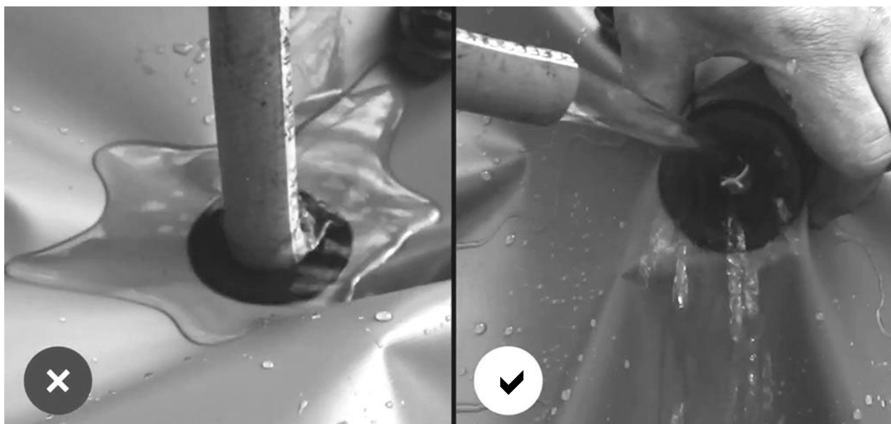
Наповнення водоналивного відсіку

Під час процесу наповнення водою для вільного виходу повітря з відсіку не слід повністю перекривати горловину клапана шлангом для уникнення створення надлишкового тиску.