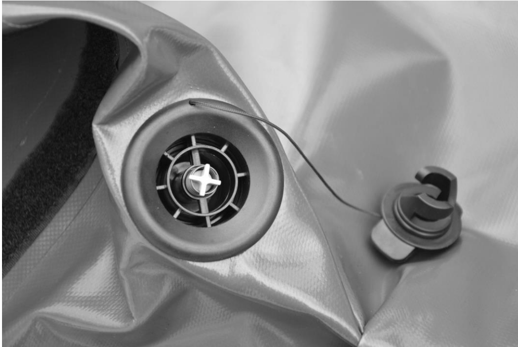
Повітряний клапан з відкритою заглушкою