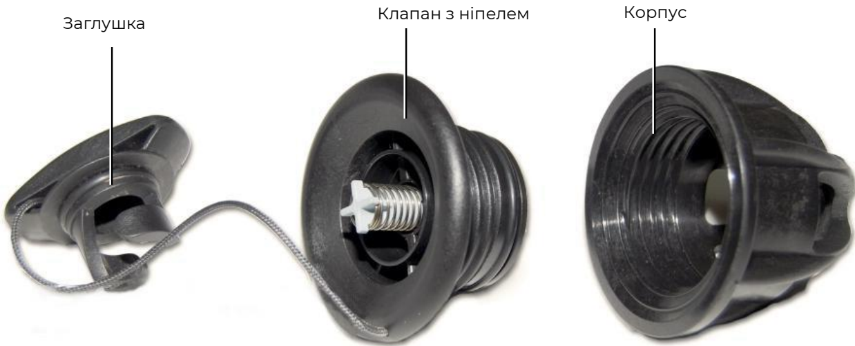
Конструкція ніпельного клапану

Ніпельний повітряний клапан (Push & Go) складається з трьох основних частин - корпус, клапан і заглушка. Для забезпечення кращої герметизації клапан обладнаний механізмом (ніпелем), що пружинить.